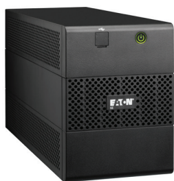
Provedení 5E 1100 USB