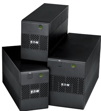
Produktová řada 5E