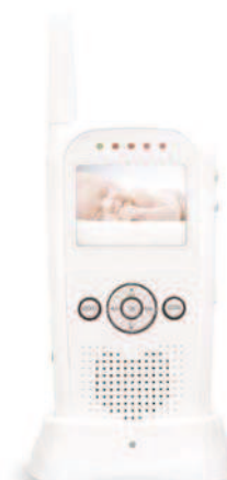
Bezdrátový přijímač Dobíjecí kolébka na přijímač