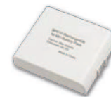
Dobíjecí akumulátor pro kameru